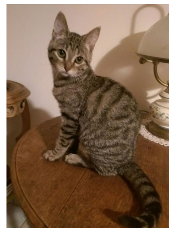
PUPUCE chez Mickaël