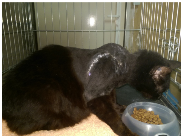
Quelques jours après l'opération